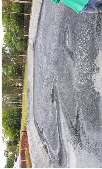
Fig. 1 – Lagoa antes da aplicação, crosta superficial, larvas, moscas, forte odor e baixa eficiência;

Além de remover crostas superficiais, reduz o lodo acumulado no fundo das lagoas, e facilita o bombeamento para lançamento, eliminando obstruções da tubulação, e aumentando a vida útil das motobombas e canhões.