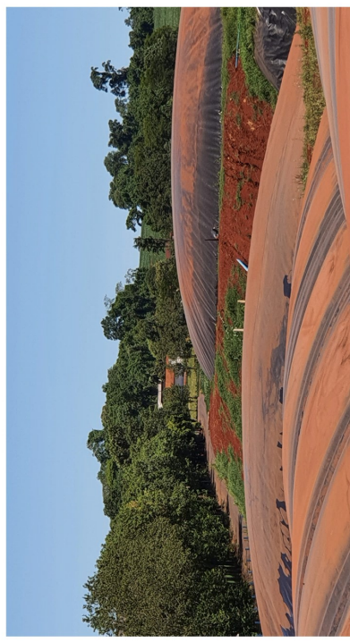
Fig. 4 – Utilização em biodigestores, aumento de 40% na produção de biogás, mais renda para o produtor;