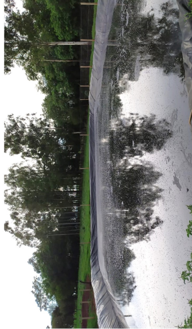
Fig. 2 – Lagoa após 48 dias de tratamento;